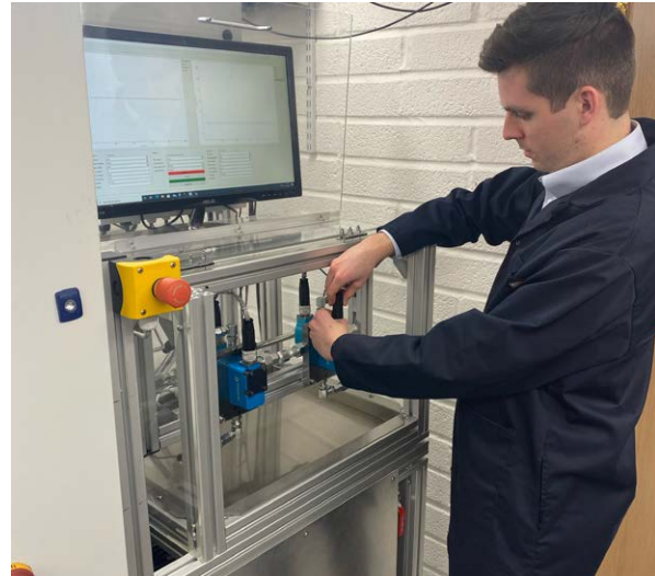
Probando una válvula de transmisión directa de FA

“En Renishaw, siempre estamos buscando oportunidades que nos permitan participar en el desarrollo de tecnologías emergentes con un impacto positivo en el mundo industrial”, añade Austin. “La FA es imprescindible para esta aplicación, ya que proporciona las ventajas técnicas y los beneficios comerciales que Domin necesita para fabricar piezas rentables, ligeras y de alto rendimiento. Estamos entusiasmados con lo que nos espera en el futuro”.