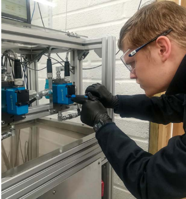
Válvulas de servotransmisión de Renishaw de Domin

La FA metálica crea los componentes macizos capa a capa con polvo metálico. Debido a la libertad de diseño de la fabricación aditiva, Domin puede construir piezas complejas, sin herramientas especiales y con la mínima preparación y ensamblaje. Por ejemplo, la FA metálica permite diseñar geometrías complejas con características internas como entramados y canales de refrigeración. Produce piezas con una rigidez óptima con relación al peso y genera menos material de desecho.