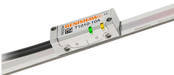
Encoder TONiC RELM

In alternativa, il confronto fra le accelerazioni delle guide dell'asse Y può fornire un ulteriore feedback di controllo sul momento del ponte. Per garantire il corretto funzionamento di questo complesso sistema di controllo è indispensabile avere encoder di posizione affidabili e accurati. Una combinazione di dati "a priori" e di feedback di posizione e accelerazione in direzione degli assi X, Y e Z viene utilizzata per massimizzare le prestazioni metrologiche.