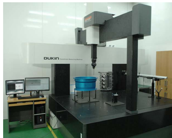
Per le proprie CMM, DUKIN si avvale di sonde REVO a 5 assi.

Inoltre, per far fronte alle sfide del mercato, DUKIN Co. ha incorporato diversi sistemi ottici e laser di Renishaw nelle proprie CMM. Questi sistemi includono: TONIC con riga dorata RGS (non consigliato per nuovi progetti, aggiornamento alternativo: scala RKLC) aderente al substrato e l'encoder laser interferometrico RLE.