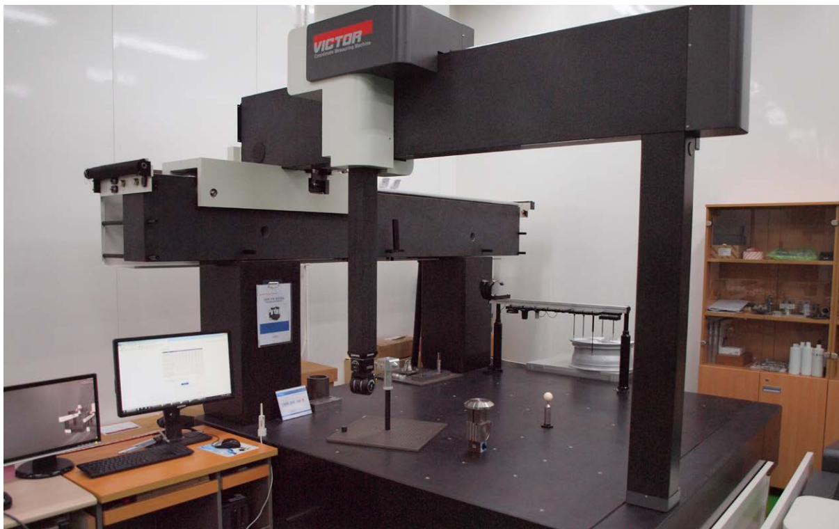
CMM DUKIN della serie Victor