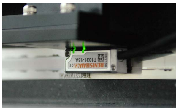
Encoder ottico TONiC RTLC di Renishaw